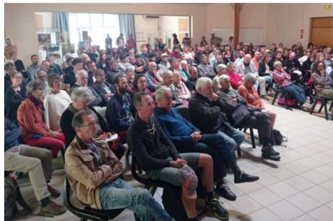
La conférence sur la gestion de l'eau a réuni un public nombreux et attentif. À droite : le village associatif pour découvrir produits locaux, syndicats ou autres associations.