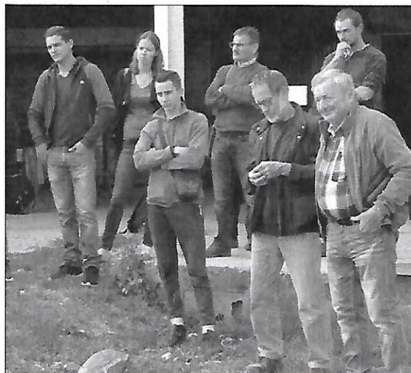
Une trentaine de personnes a participé à l'après-midi d'échange sur le thème de l'installation-transmission d'une exploitation agricole à Arras-sur-Rhône.